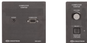
IM-WCC-S Wandeinbau-Einspeisepunkt mit abgesetztem Bedienelement