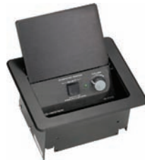
IM-FTCC (in 2006) Tischeinbau – Einspeisepunkt