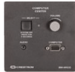
IM-WCC Wandeinbau – Einspeisepunkt